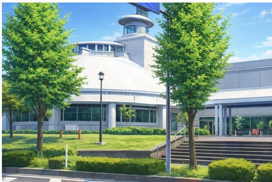
市民交流プラザ 市民ギャラリー