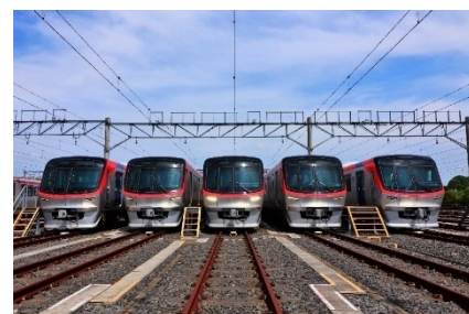
TX 総合基地車両正面