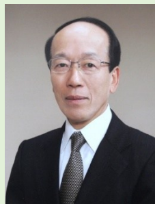
もりや市民大学学長

守谷市民は、この街が「住みやすい街」とどまらず、「住み続けたい街」「魅力ある街」「愛される街」でもあることを望んでいると思います。もりや市民大学は、市民に学びの機会を提供しつつ、その学びが守谷市のさらなる発展に活かされて欲しいと願っています。ここでの原動力は「楽しい学び」です。本年度も4つのコース、公開講座、市民科学ゼミなどのプログラムを準備しました。ぜひ、「楽しい学び」を満喫していただきたく、皆様のご入学を心待ちにしています。